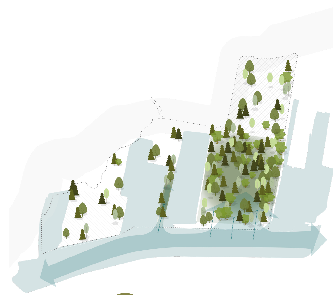
Getijebos als uniek stukje natuur