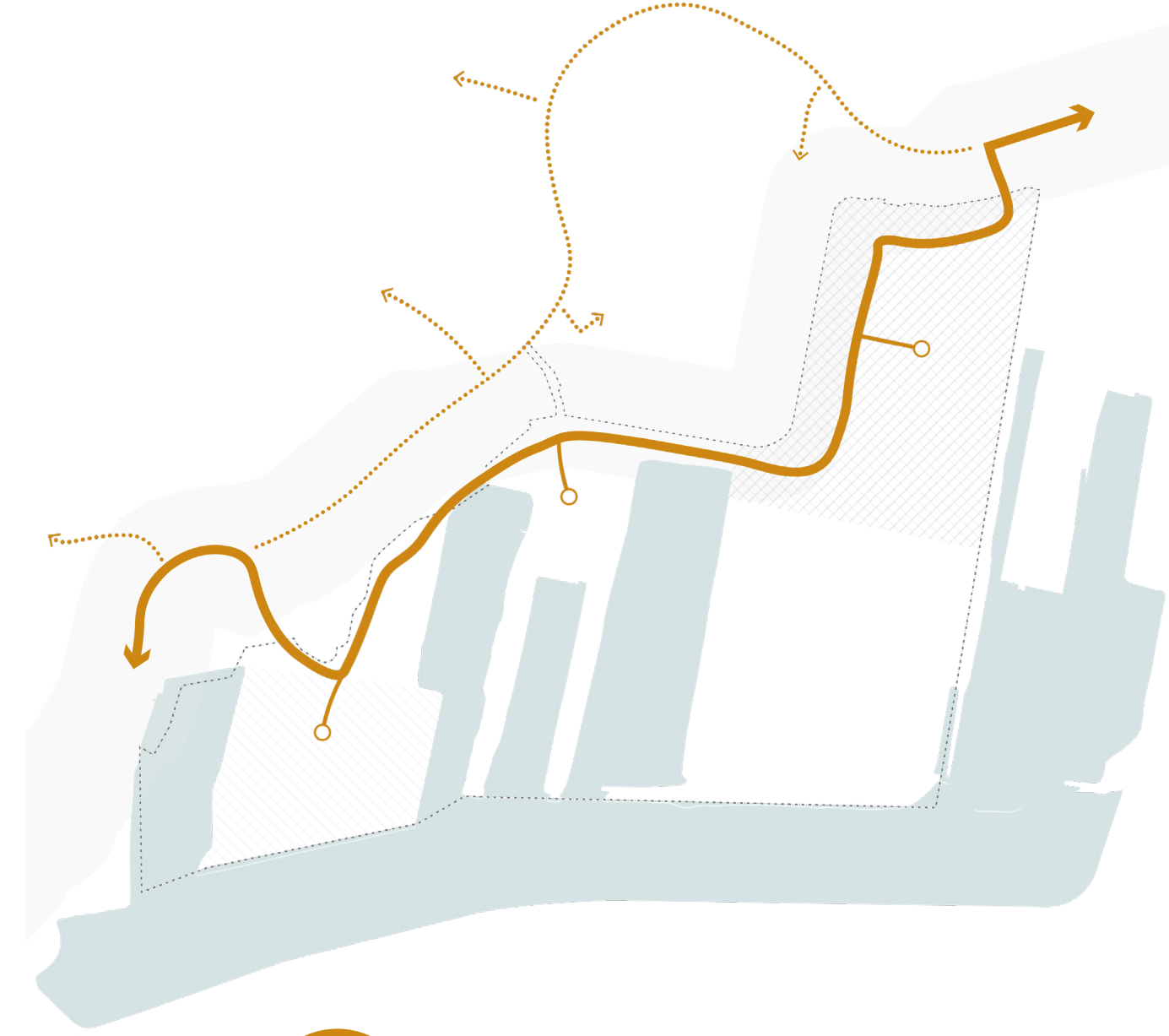
Ontsluiting verdelen over de dijk, met voldoende parkeergelegenheid