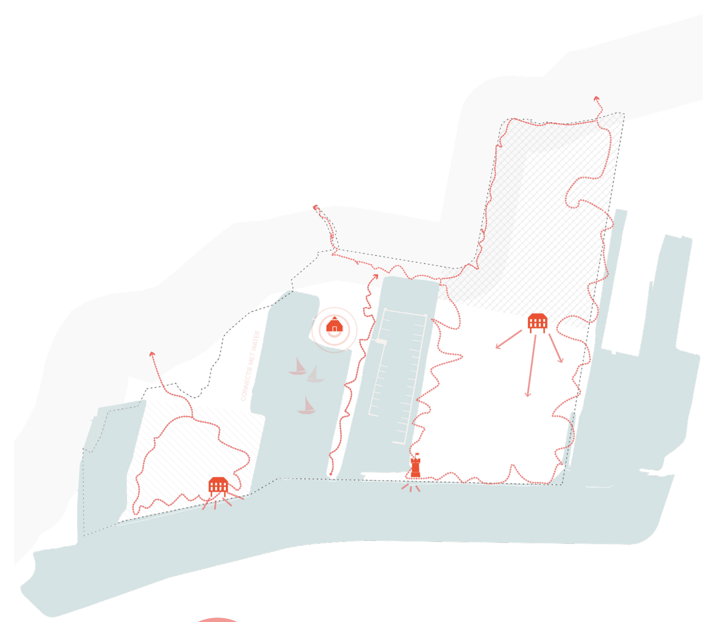
De Lek actief beleven