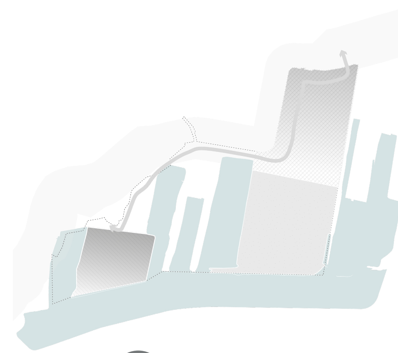
Overlast voorkomen in gesprek met bewoners